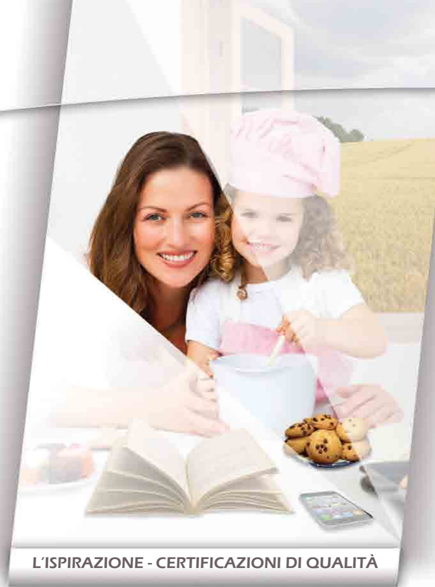
L'ISPIRAZIONE - CERTIFICAZIONI DI QUALITÀ